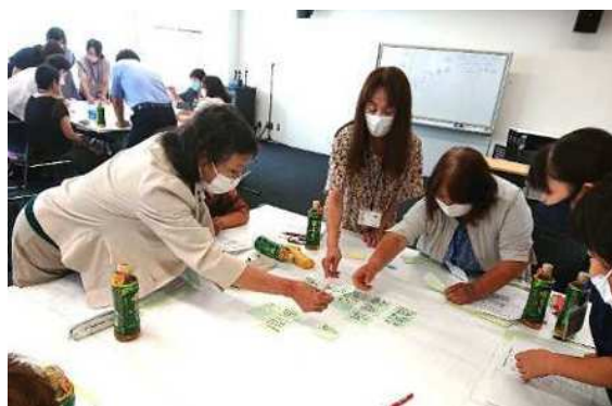
地区別懇談会 (R6 県北地区)