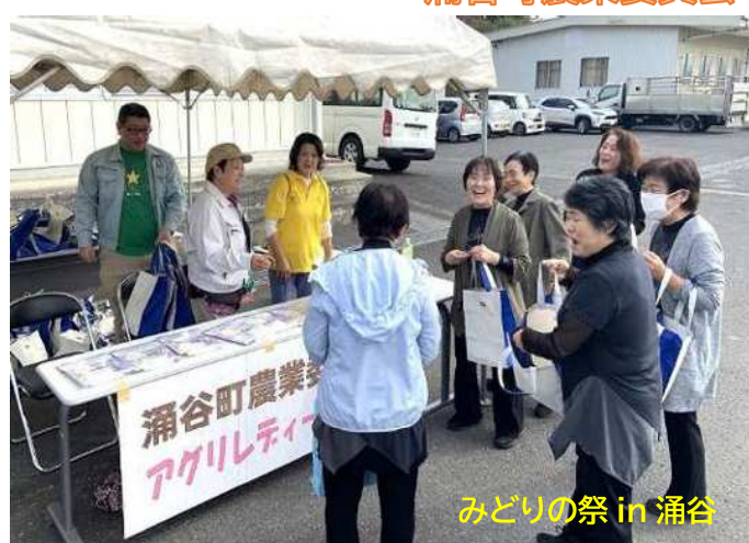
みどりの祭 in 涌谷

各市町村で女性の農業委員・農地利用最適化推進委員が活躍しています!! あなたも私たちと一緒に農業委員会で活躍しませんか!!