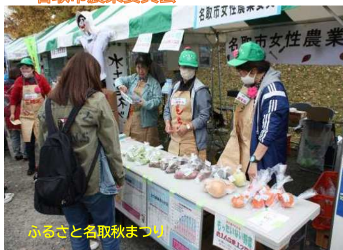
ふるさと名取秋まつり