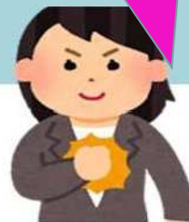
農業委員会別委員に占める女性委員の割合(宮城県:34 農業委員会)

多くの女性委員 が各市町村で 活躍しています! あなたも私たち と一緒に農業委 員会で活躍しま せんか!!