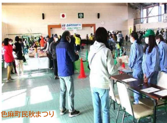
色麻町民秋まつり