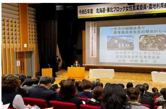
北海道・東北ブロック女性委員等研修会 (R5 秋田県)

宮城県農業会議との共催により、農地法等の農業委員会業務に関連のある法令や政策、各種制度等を主な内容に、年間 2、3 回の研修会を開催しています。また、北海道・東北各県の女性委員等組織・農業会議・全国農業委員会女性協議会との共催による研修会に参加し、広域の意見交換・交流を行い、相互研鑽と情報の共有に努めています。