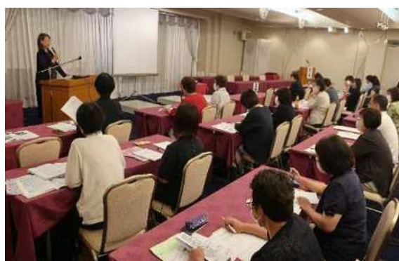
市町村農業委員会女性委員等研修会 (R6 仙台市)

また、県と県内の女性農林漁業者組織との共催で「パートナーシップ推進宮城県大会」を開催し、農山漁村での男女共同参画社会の実現を目指しています。