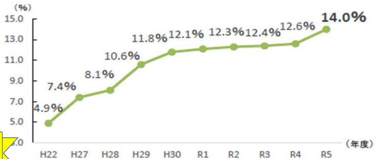
○農業委員に占める女性の割合 【全国】