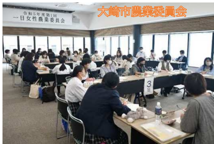
大崎市農業委員会